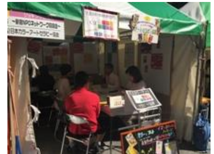
↑3年間 新宿区ふれあいフェスタにて 無料心理カウンセリング実施