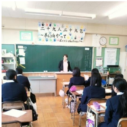
→カラーアート手話交流会 隔月実施

←石巻市立北上中学校にて エステティシャンの仕事について職業講和 被災地の仮設住宅の子どもたちへ 心理カウンセリングボランティア